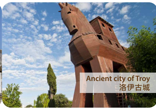
Ancient city of Troy 洛伊古城