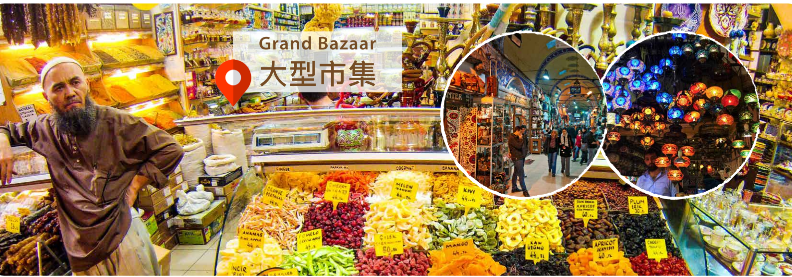
Grand Bazaar 大型市集