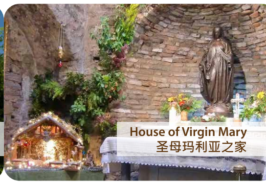
House of Virgin Mary 圣母玛利亚之家