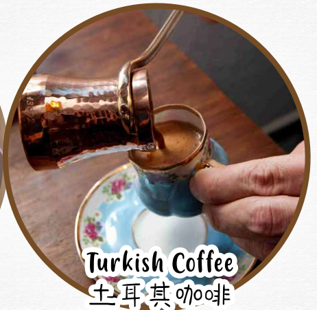
Turkish Coffee 土耳其咖啡

* Picture shown are for illustration purpose only * 照片仅供参考