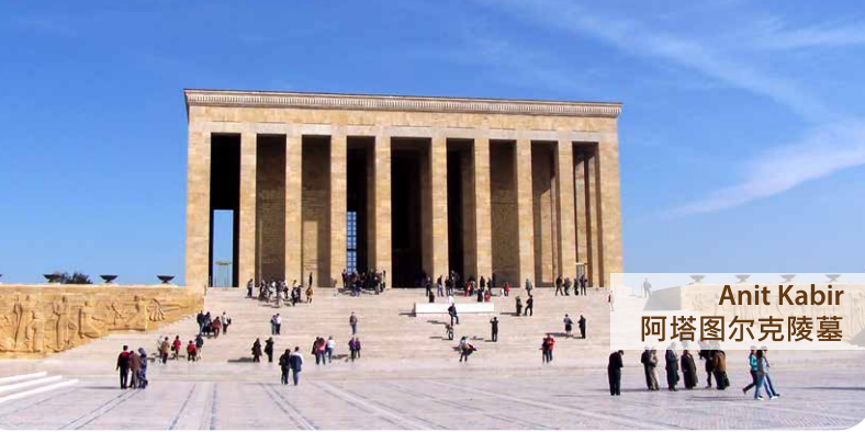
Anit Kabir 阿塔图尔克陵墓