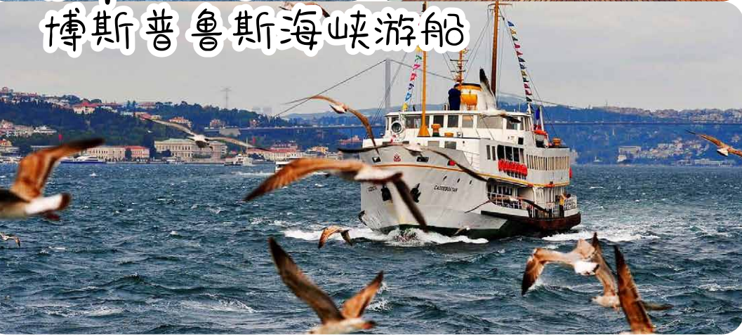
博斯普鲁斯海峡游船