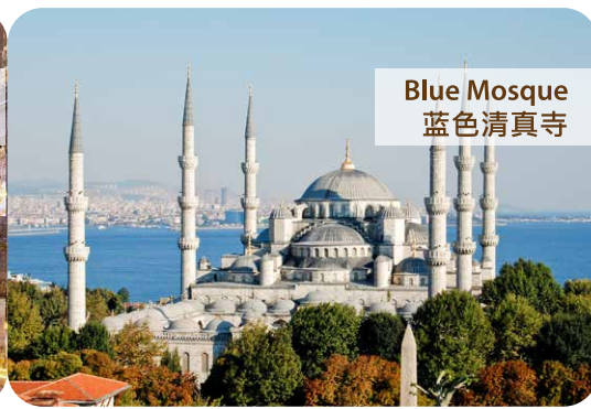
Blue Mosque 蓝色清真寺