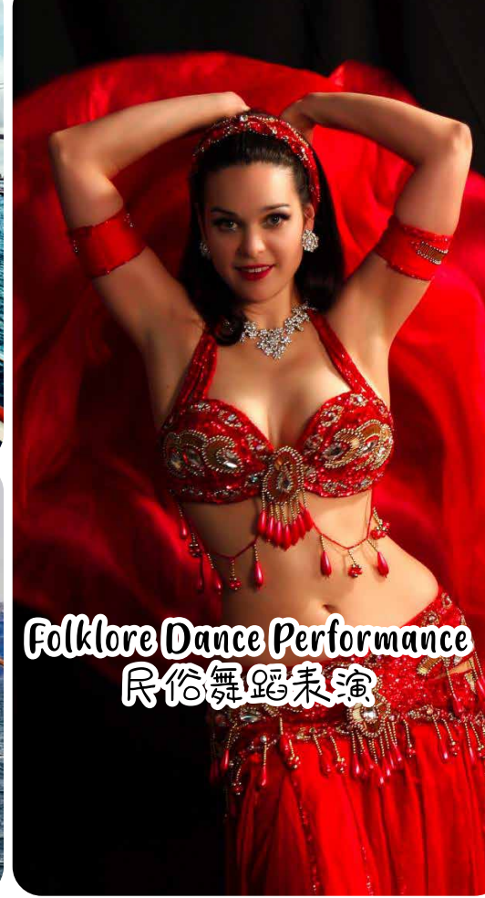
Folklore Dance Performance