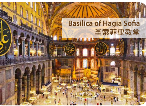
Basilica of Hagia Sofia 圣索菲亚教堂