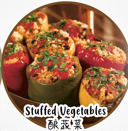
Stuffed Vegetables 酿蔬菜